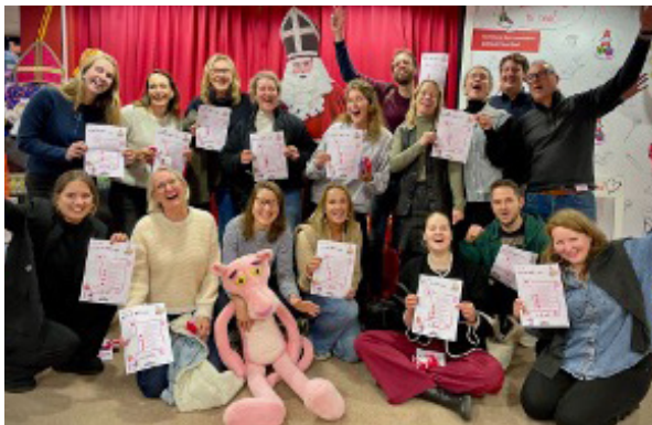
17 Tappanners pakten cadeaupakketten in, overhandigden de door ons ingezamelde cadeaus aan stichting Sintvoorieder1 én ontvingen een inpakdiploma.

Net als in 2022 en 2023 hielpen we de stichting Sintvoorieder1 om ervoor te zorgen dat zo veel mogelijk kinderen die opgroeien in (verborgen) armoede een cadeaupakket krijgen met Sinterklaas. Dit jaar hebben we met 17 Tappan-collega's maar liefst 379 cadeaupakketten ingepakt. Een groot deel van hen nam bovendien cadeaus mee als donatie.